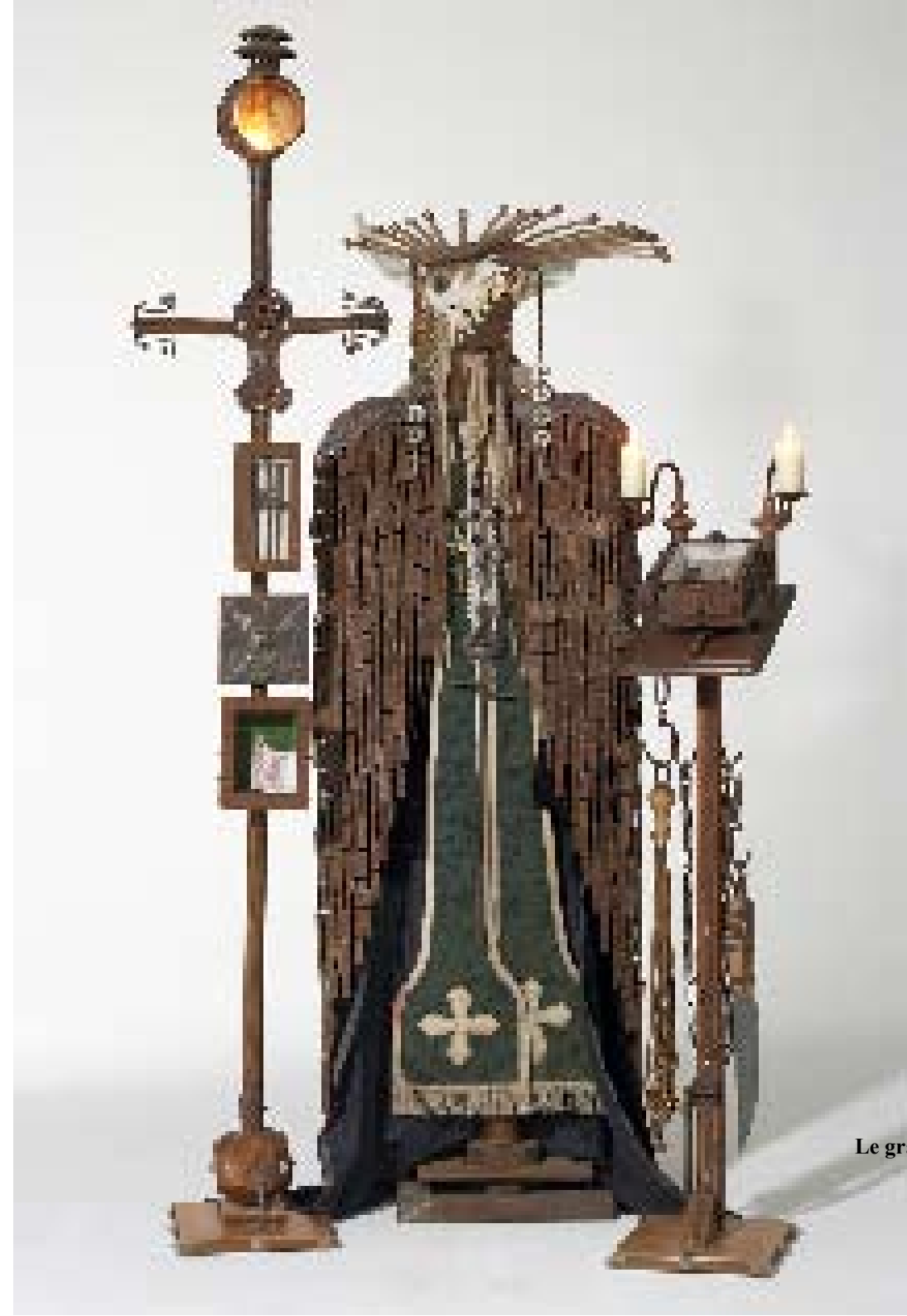
Le grand inquisiteur