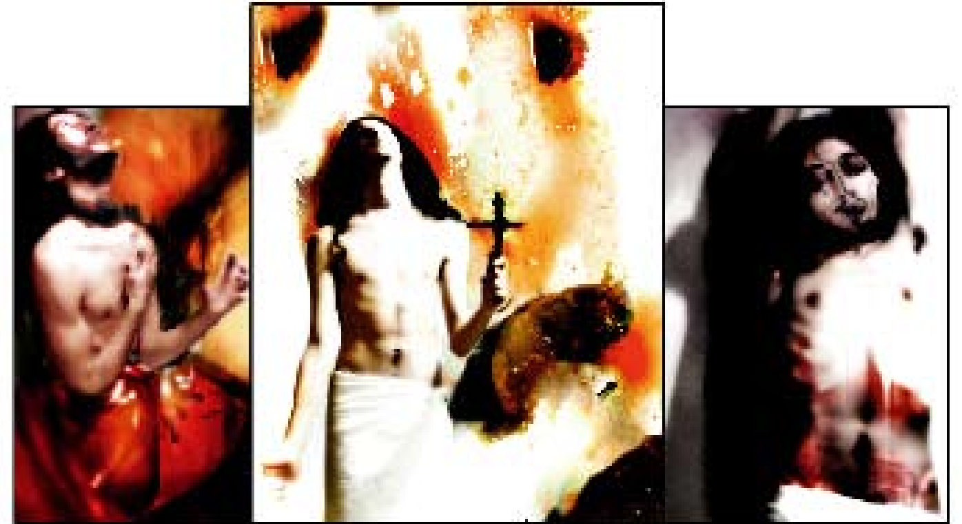
Etiamsi Deus non daretur